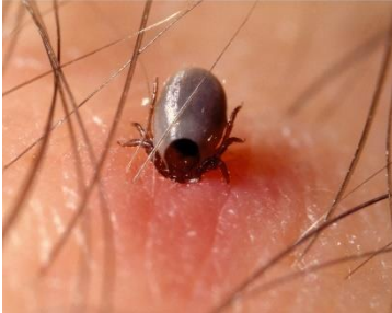
Slika 2. Klop na koži.

Klopi lezejo po rastlinju, navadno do višine kolen, in čakajo na primerne gostitelja. Klopi ne skačejo, ne padajo z dreves, ne letijo in ne tvorijo nitk, po katerih bi se spuščali kot pajki. Ker so slepi, gostitelja ne morejo videti. Njegovo bližino zavohajo ter začutijo njegovo telesno toploto in premikanje med vegetacijo. Oprimejo se nas le, če se dotikamo listja, trave, podrasti ali mimogrede oplazimo rastlinje. Nato poiščejo ustrezno mesto na koži, kamor se pritrdijo. Pri človeku so to nežni in vlažni deli telesa, kot so pod pazduhe, dimlje, pregibi rok, nog in kožne gube.