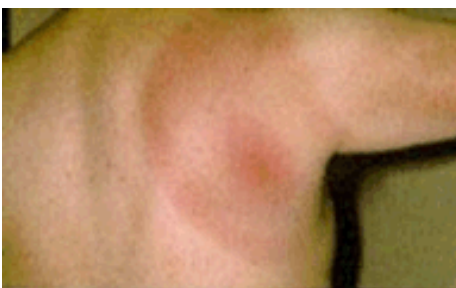
Slika 3. Rdeča lisa je znak okužbe z boreliozo.

Bolezen se zdravi z antibiotiki. Zdravljenje je najuspešnejše v začetni fazi obolenja, zato je pomembno obiskati zdravnika takoj, ko se pojavi rdečina na koži . V kasnejših stadijih je ozdravitev pogosto nepopolna in z resnimi trajnimi težavami. Za bolezen ni cepiva.